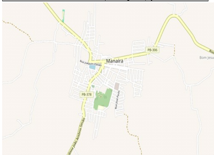
Município de Manaíra-PB, de acordo com o MOPS MDS.